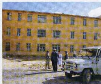
L'arrivée à l'hôpital

Le docteur Gouliza est ophtalmologiste mais elle n'a jamais opéré sous microscope. René a pour mission de lui enseigner les gestes et les protocoles chirurgicaux afin qu'elle devienne autonome. La liste des patients a été établie. Parmi eux un petit garçon de cinq ans souffre d'une cataracte depuis la naissance, il est quasiment aveugle , percevant à peine la lumière d'une lampe placée tout près de ses yeux. Les adultes seront opérés sous anesthésie locale, par contre le petit bonhomme devra être complètement endormi . Si les coupures de courant persistent, ce ne sera pas possible. Mais la réussite est au rendez-vous. Non seulement René a pu opérer vingt-huit cataractes et quatre glaucomes mais, surtout, il a pu intervenir sur le petit garçon qui aussitôt a montré de très nets signes d' amélioration puisque pour la première fois de sa vie, il pouvait voir et donc saisir un objet qui lui était présenté ! Si l'on ajoute à ce palmarès quelque deux cents consultations et le début d'une solide formation pour le docteur Gouliza, on peut dire que la petite ONG ACTIONS MONGOLIE a assuré comme une grande professionnelle.